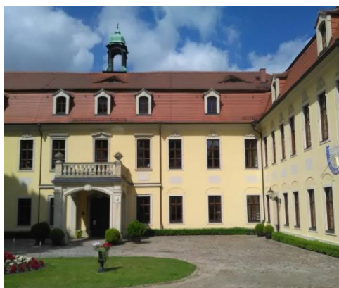
Blick auf das Hauptschloß